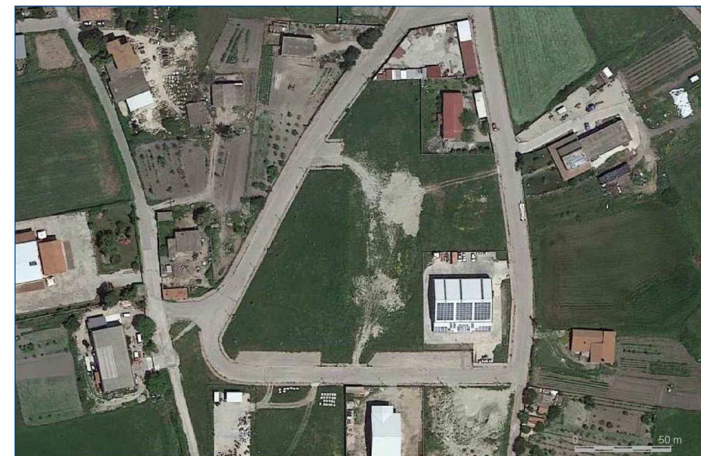
Inquadramento della zona di intervento - Scala 1 : 2.000