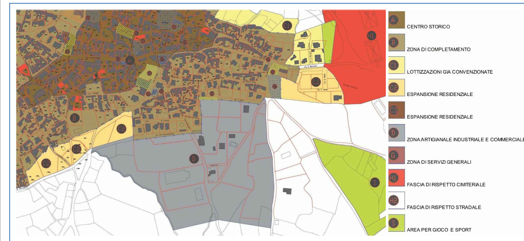
Estratto Piano Urbanistico Comunale - (Fuori scala)