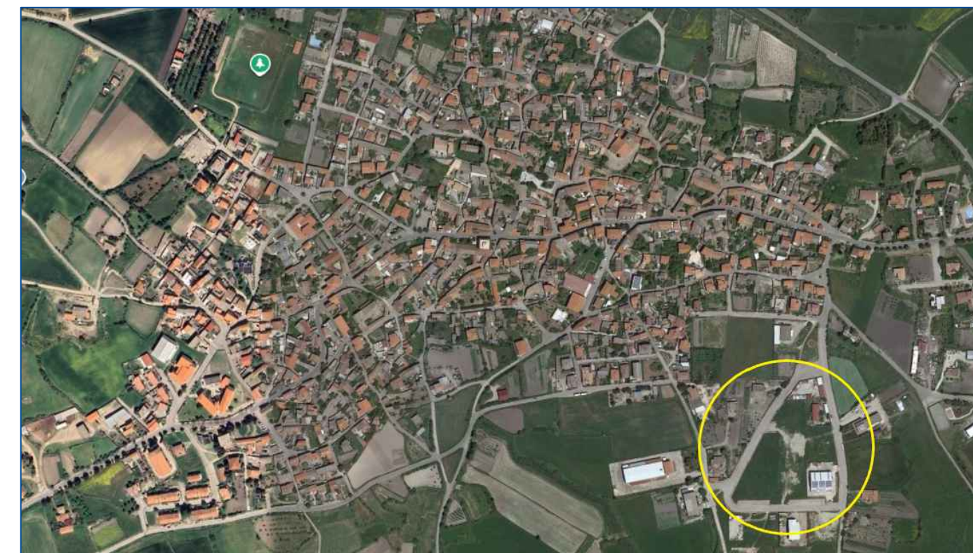
Inquadramento generale - (Fuori scala)